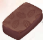
Neg mawon Ganache chocolat noir 72%